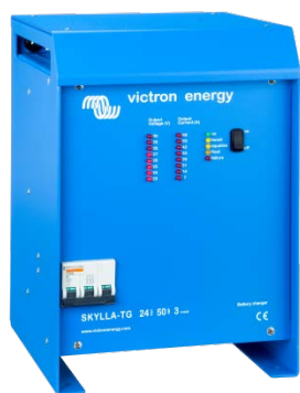
Skylla TG 24 50 3 phase

Pro lepší seznámení s bateriemi a jejich nabíjením, doporučujeme přečíst si naši publikaci „Energie bez hranic“ (Je k dispozici zdarma od Victron Energy nebo jí lze stáhnout z www.victronenergy.com ).