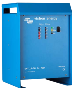
Skylla TG 24 100